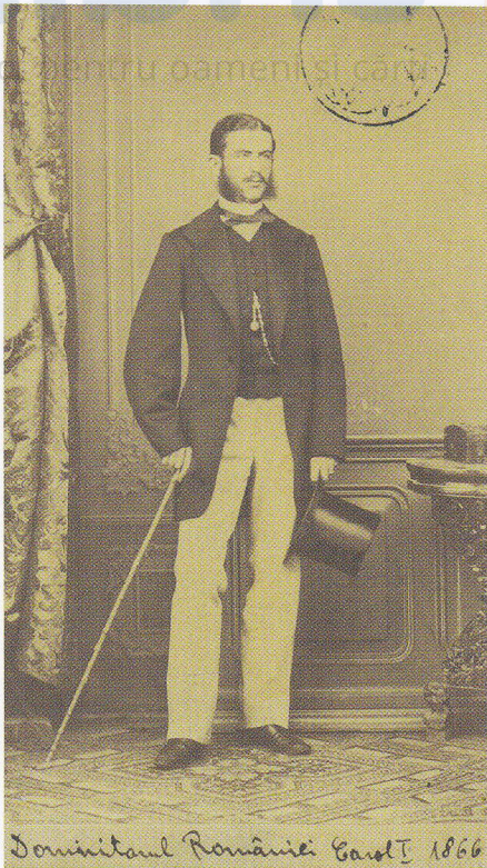
Domnitorul României Carol I 1866